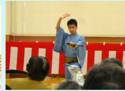
しっとりとした日本舞踊

～施設行事～ 8月には、O組(わぐみ)、9月には琴の演奏、10月は賀寿江会の皆様が慰問に訪れてくださいました。利用者様方は、どのステージも目を輝かせて見入っていました。素敵なステージをありがとうございました。