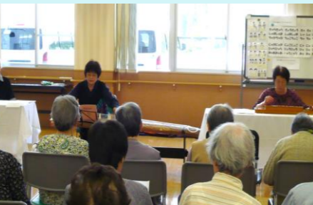
きれいな音色の琴演奏