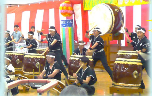
大森創作太鼓様 迫力のある演奏でした