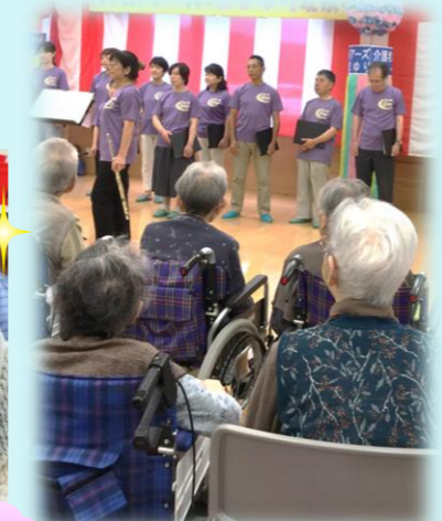
コール潮騒様 素敵なお歌声でした