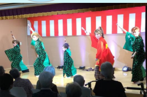
迫力もあり華麗な舞

～施設行事～ 8月には、O組(わぐみ)、9月には琴の演奏、10月は賀寿江会の皆様が慰問に訪れてくださいました。利用者様方は、どのステージも目を輝かせて見入っていました。素敵なステージをありがとうございました。