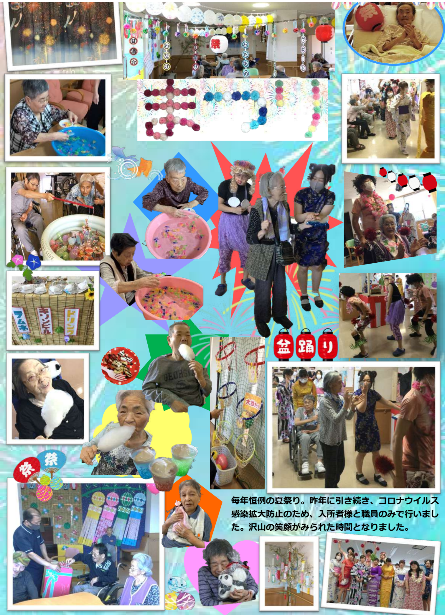
毎年恒例の夏祭り。昨年に引き続き、コロナウイルス感染拡大防止のため、入所者様と職員のみで行いました。沢山の笑顔がみられた時間となりました。

数日前から始めた夏祭りの飾り付けを見ては、「お祭りいつ?」「アイス予約しておきます」とワクワクして待って下さっている気持ちが伝わっていました。当日はわにわにパニックゲームで競い合い、ヨーヨー釣りでカップラーメンやわたあめ等を釣り上げ、笑顔が溢れていました。余興では珍しい各国の華やかな衣装をまとった、普段とは違う装いの職員に驚き、目が釘付けになっていました。女装した職員を勘違いし綺麗だと喜ぶ男性利用者様も・・・そしてやぐらを囲んで盆踊り。昔を思い出し、皆で一つになって炭坑節を踊りました!たくさんの笑顔が輝く夏祭りとなりました☆